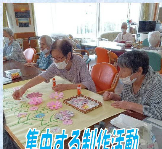
集中する制作活動