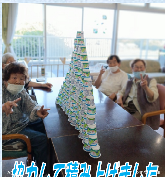
協力して積み上げました