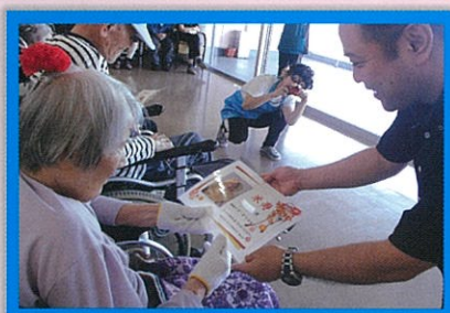
歳祝いのカード贈呈!