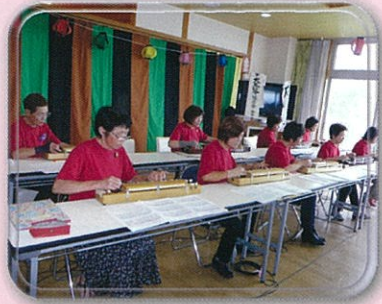
大正琴ボランティア 「琴志会 金谷」