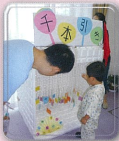
ゲームする子供たち

平成29年7月22日(土)に毎年恒例の海山荘の夏祭りが行われました。 今年のステージは大正琴のボランティアの皆様に来ていただきました。迫力ある演奏を披露していただきました。職員の日々練習してきたダンスや演劇も好評でした！